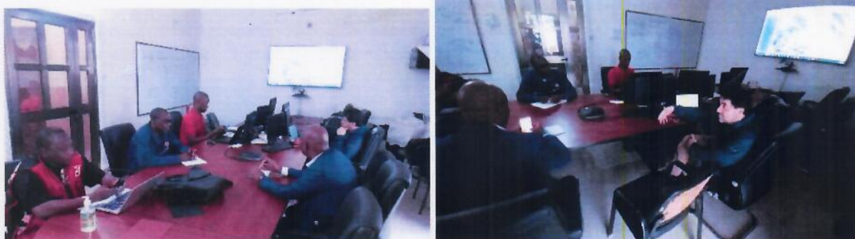
1 ère réunion dans la salle de crise du Centre des Opérations d'Urgences de la CRM. Personnes de gauche à droite : Secrétaire Général, Représentant PNS, Coordinateur National FbF, RROps Manager Mali et National Society

La Fédération internationale de la Croix-Rouge et du Croissant Rouge (FICR) à travers son cluster de Niger a été informé du déclenchement sur la base des informations de la DNH.