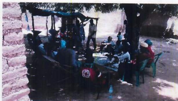
Arriver de l'équipe FbF dans le village de Kaka avec les membres de Gouvernorat et la Mairie Rencontre avec le chef du village et les membres de la communauté