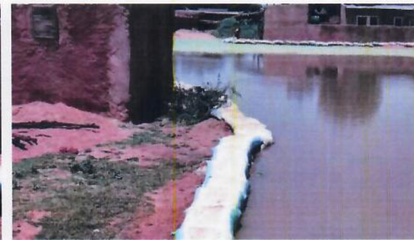
Activités de protection des maisons avec les sacs de bancos