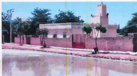
Atelier de restitution de la mission avec les services techniques Protection de la mosquée de Sofara