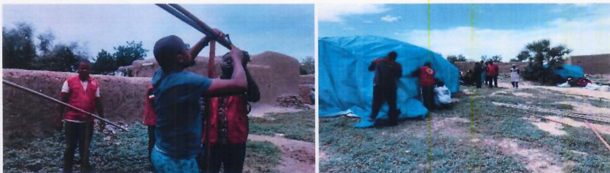
Activités de distribution et l'installation des tantes abris