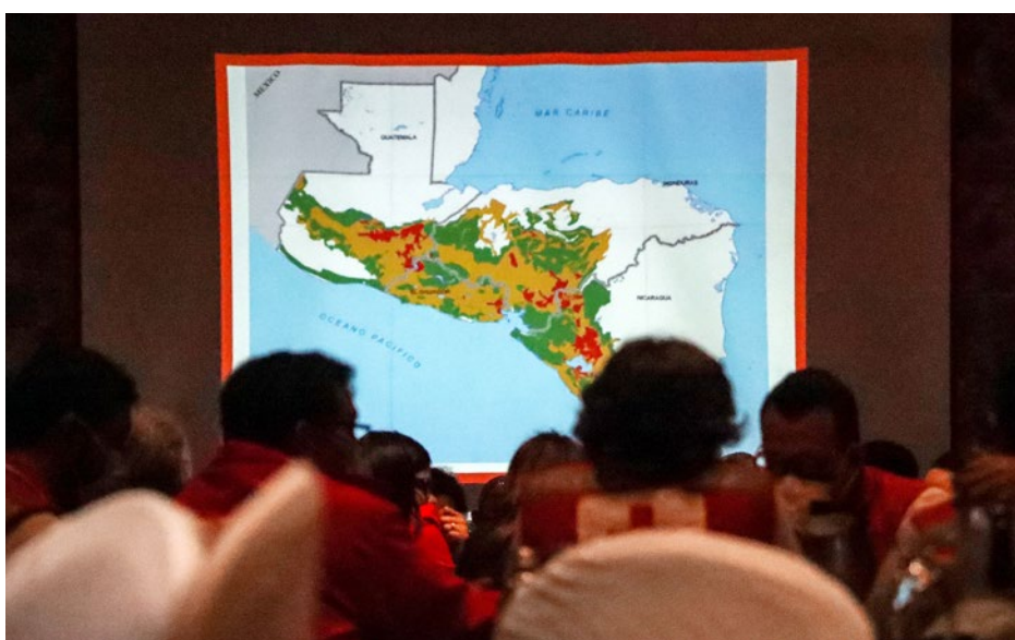
En la simulación se evaluaron escenarios de activación ante sequía en Guatemala