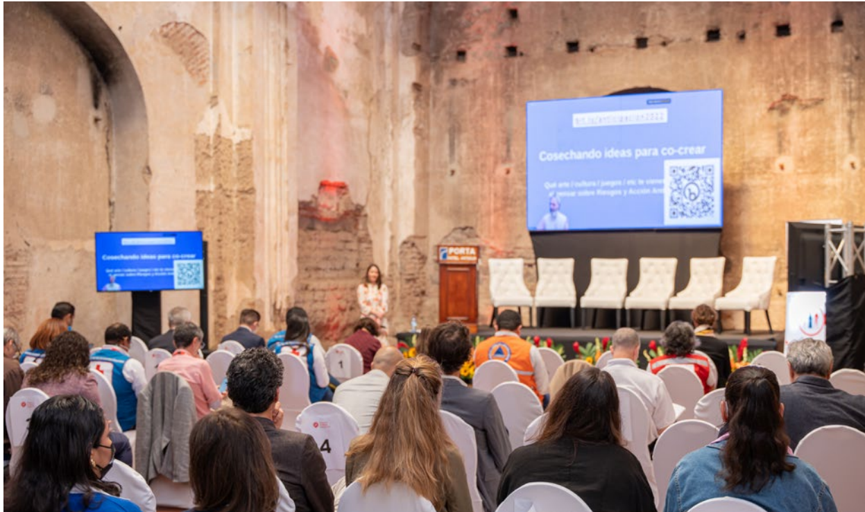
La plataforma apostó por mantener espacios de interacción híbridos

La siguiente dinámica fue una lluvia de ideas “Semilla” para comunicar el riesgo y la acción anticipatoria. Se propusieron ideas como El Principito, Laberintos, Murales Colectivos, etc. Posteriormente, sobre cada idea semilla se daba click para proponer ideas específicas de formas de comunicar algo acerca de las acciones anticipatorias.