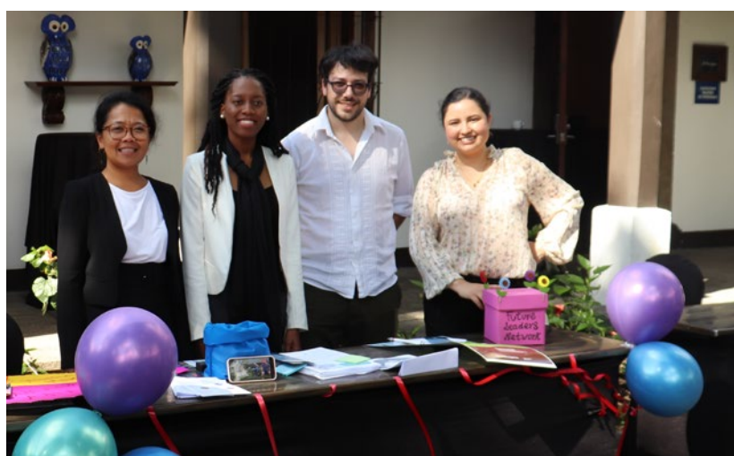
Durante la feria se expusieron diversas iniciativas de forma creativa