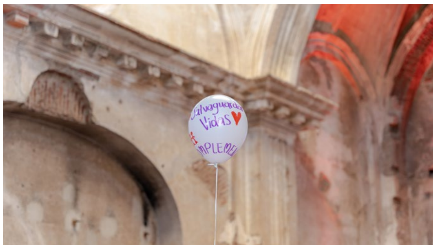
Una dinámica para romper el hielo