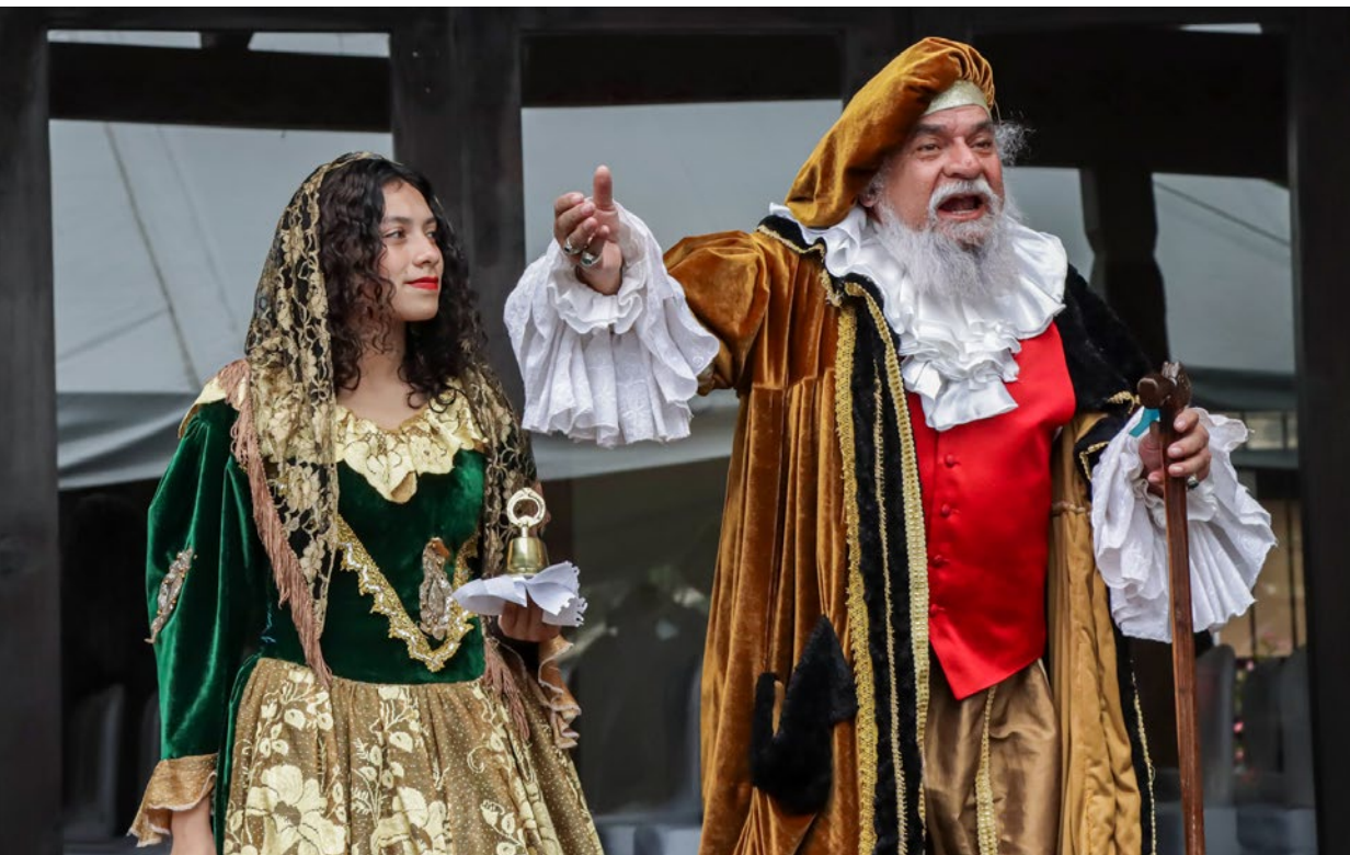
Durante el evento se aprovechó a compartir sobre la diversidad de la cultura guatemalteca