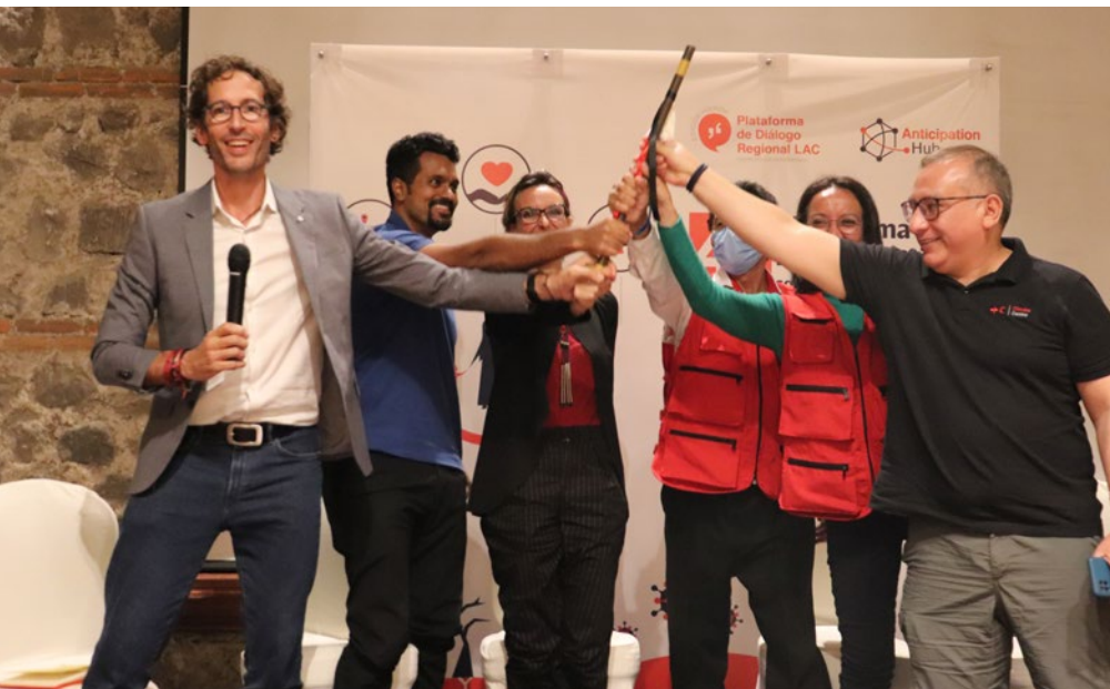
Cierre del evento con el compromiso de promoviendo la acción anticipatoria