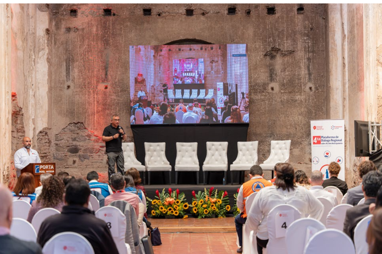
Los ignites destacaron ejemplos prácticos para la acción anticipatoria